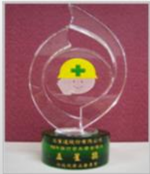
勞工安全衛生「五星獎」 The Best Labor Safety and Health Award