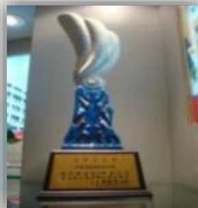
勞工安全衛生優良單位 The Best Unit of Labor Safety and Health