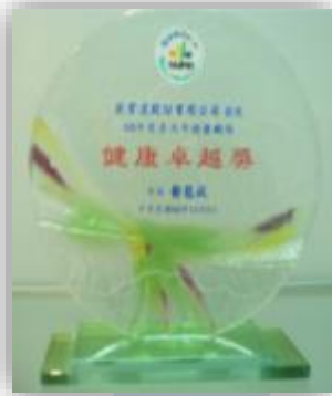
健康職場-健康卓越獎 Health Workplace- Health Excellence Prize