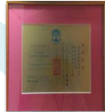
國家公益獎 National Award for Social Welfare