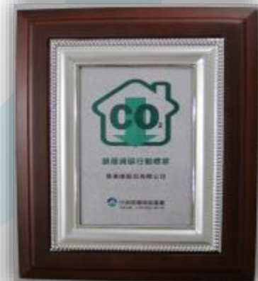
「節能減碳行動標章」績優獎 The Best Action of Carbon Reduction Award